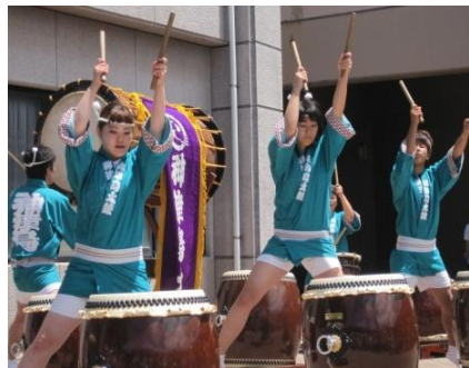
エンディング ブルーカレンツ