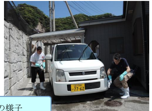
施設の車両清掃・外回りの清掃・職員の車両洗車の様子